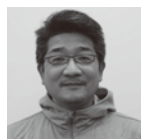
ディレクター SEKI DESIGN STUDIO