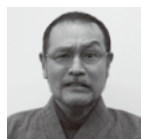
加賀友禅 加賀友禅工房 文庵