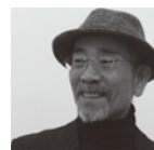
人文コーディネーター