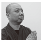
金沢仏壇 大竹仏壇製作所