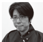
加賀友禅 株式会社 鶴見染飾工藝