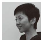
ディレクター SEKI DESIGN STUDIO